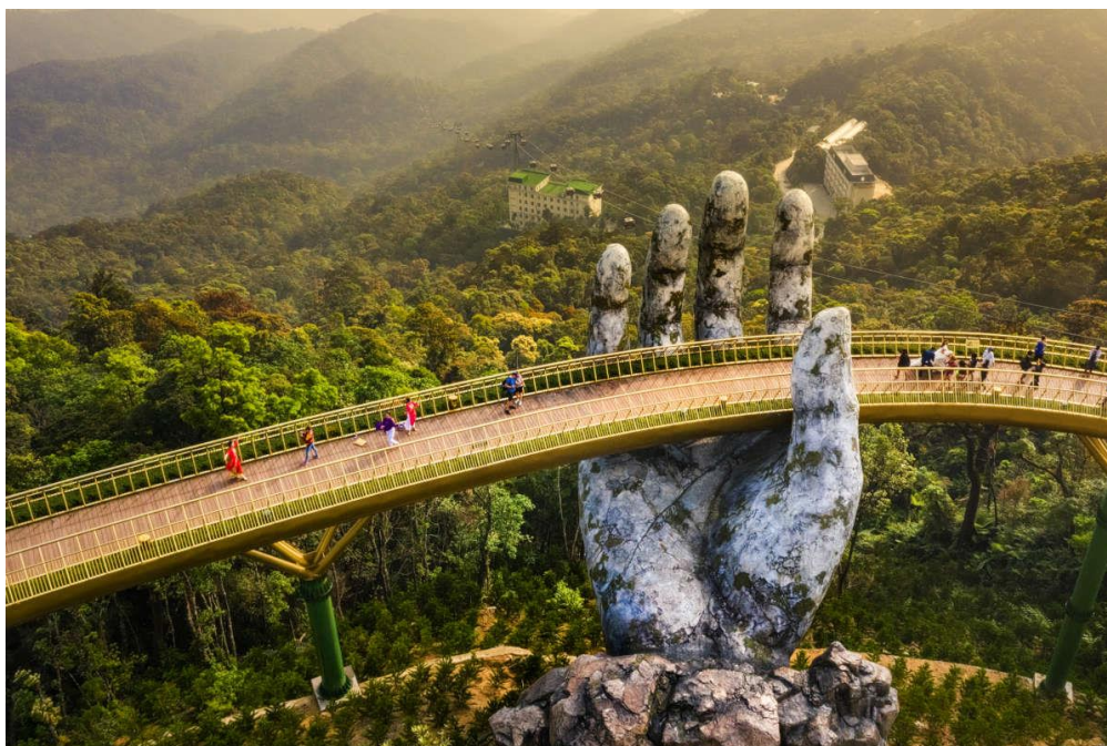
Vietnam – Gold Bridge

Più tardi ricevette anche supporto dall'ACBL International Fund e dallo Junior Fund.