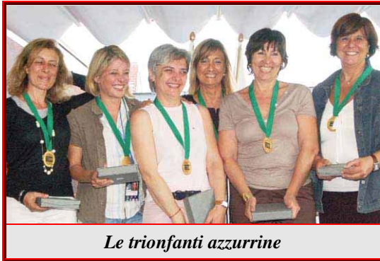
Le trionfanti azzurrine

meraviglioso mondo del Bridge, non solo è possibile confrontarsi con i big senza ancora esserlo diventati, ma, addirittura, è anche possibile batterli!