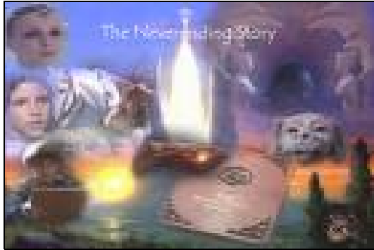
La Storia Infinita

Nel farlo, non corre un rischio molto grosso per quanto concerne la possibilità di venire contratto, perché, una volta scoperto il Fit a picche della Linea nemica, Ovest può essere quasi certo di averne uno anche sulla sua.