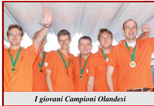
I giovani Campioni Olandesi

Su un campo di 129 Squadre, negli Open trionfano i giovani olandesi che dimostrano l'efficacia della gran cura che la Federazione dei Tulipani dedica ai suoi pulcini.