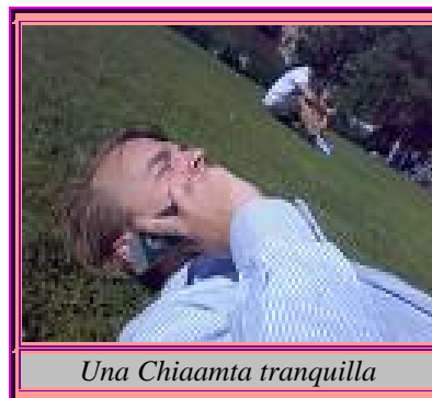
Una Chiaamta tranquilla

Non è che Est stia mostrando gradimento per le picche, piuttosto egli vi sta invitando a non riuscire a quadri e, se associate questa informazione alla tracotanza delle picche del Morto e all'apertura di Sud, capirete che Est vi sta semplicemente comunicando che, almeno dal suo punto di vista, non ci sono più prese laterali da incassare.