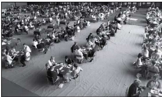
Una panoramica dei Campionati 2008

Nel 2008 le due manifestazioni si sono nuovamente separate e, mentre la WBF propone i Campionati Giovanili in occasione dei World Junior Camp , la