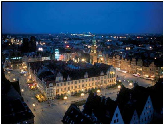
Wrocław by night

Breslavia è una città di 640.000 abitanti della Polonia sud-occidentale, la quarta del paese per popolazione, capitale del Voivodato della Bassa Slesia e capitale storica della Slesia germanica, avendo fatto parte della Germania fino al termine della seconda guerra mondiale, nel 1945.