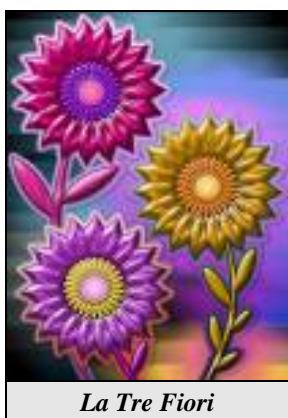
La Tre Fiori

L'Apertura non sacrifica il barrage a fiori che fa parte delle possibilità contemplate dall'Apertura di 2♠ che incontreremo tra non molto.