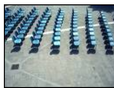
I Posti Liberi

11 sono i posti liberi nella sua Mano e 36 sono le carte non conosciute da Est (le 52 del mazzo, meno le sue 13, meno le 3 che Ovest ha dichiarato di non avere e che non ha nemmeno Est, ossia: l'Asso di quadri ed i due Re di fiori e di cuori), meno i due Assi che Ovest ha, invece, dichiarato di avere.