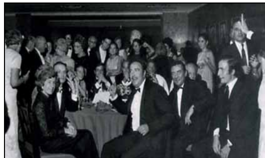
Bermuda Bowl 1969

Si noti come il rispondente, può ripetere il sottocolore per trasferire il gioco della mano all'apertore (lo potrebbe fare anche in caso di negatività con 3♦).