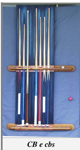
CB e cbs

Come già detto, il semplice fatto di iniziare la sequenza delle Cue Bid non implica necessariamente e che Ovest abbia una apertura di rovescio, egli potrebbe avere iniziato l'indagine per mera cortesia